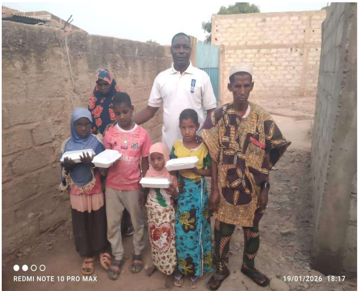
Rapport trimestriel Collectif d'Associations en Soutien aux Enfants Défavorisés. Novembre 2025 à janvier 2026.