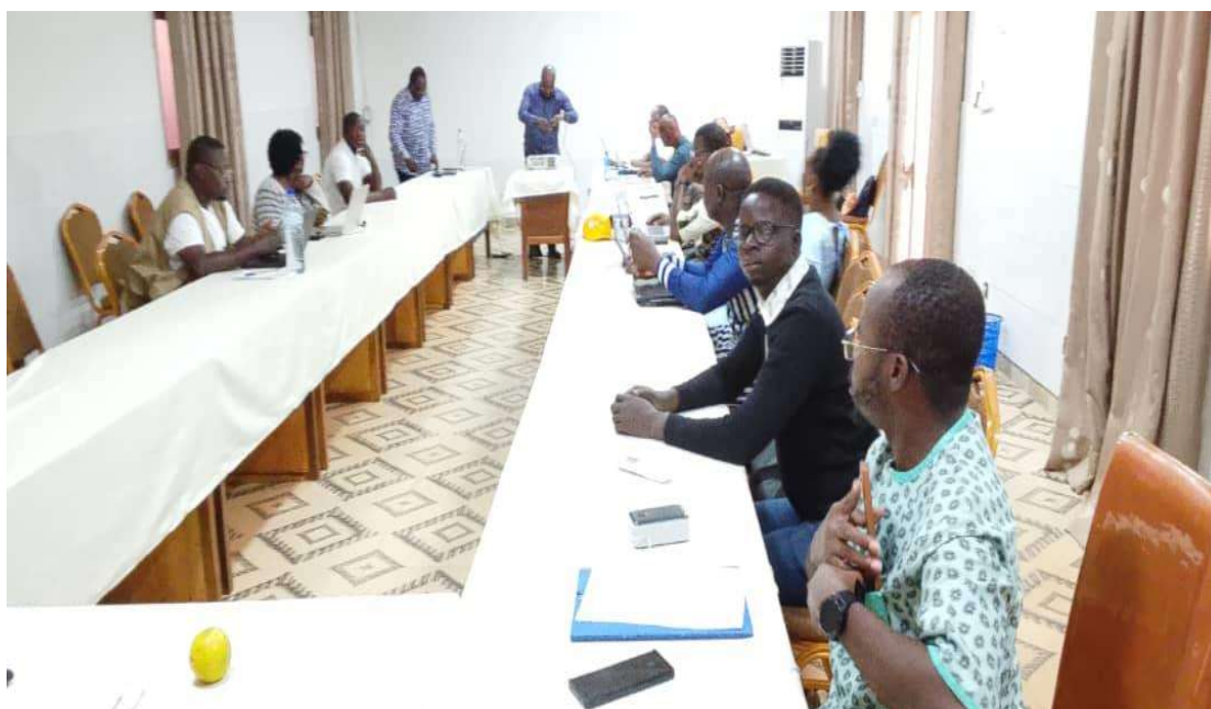
Atelier avec participation active de notre Collectif.