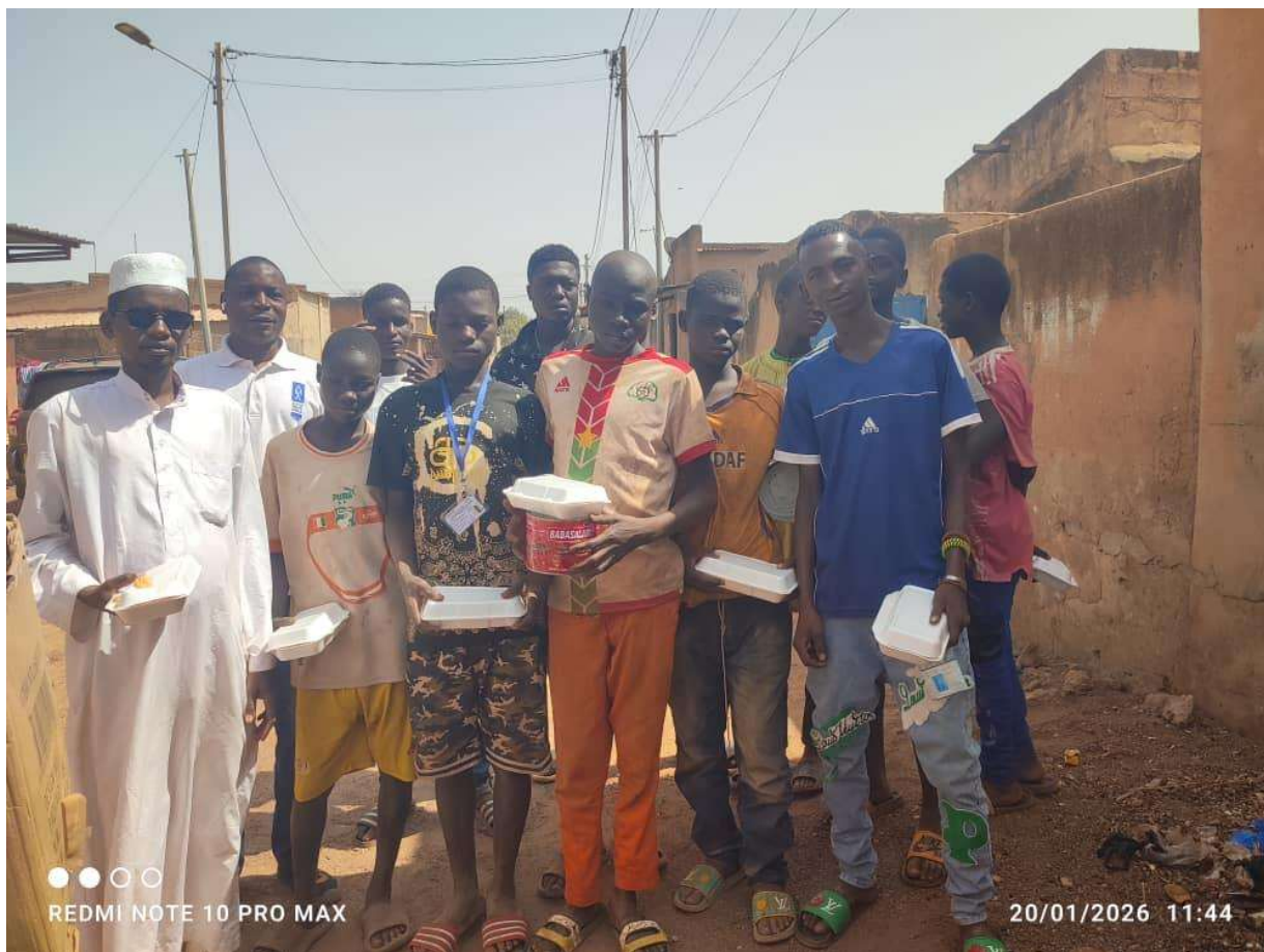
Distribution de kits repas.